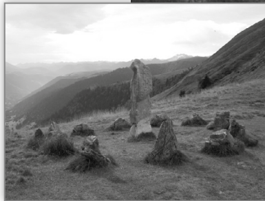
Ci-contre : Eth calhau de Pèira Hita (Borg de Oelh).