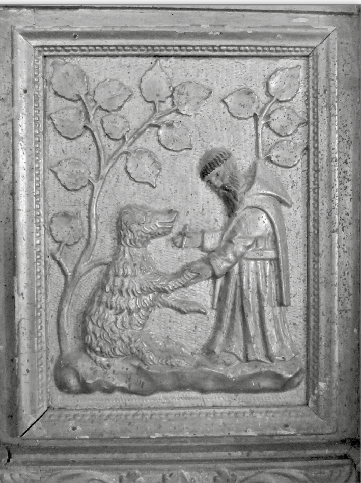
Saint Aventin et l'Ours, maître autel, bois doré, église de Saint Aventin.

Par sa vie pastorale, ermite à Astòs , sa rencontre avec l'ours à qui il retira une épine de la patte et son épopée merveilleusement épique, saint Aventin semble un dieu. La trace de son pied sur le seuil de la chapelle de Pòns , souvenir de son saut gigantesque au-dessus la vallée depuis la tour de Castèth-Blancat à Saccourvielle lorsqu'il était chassé par les « Sarrasins », était scrutée par les jeunes filles pour savoir si elles allaient se marier dans l'année. Bien évidemment, saint Aventin est la continuité de certaines