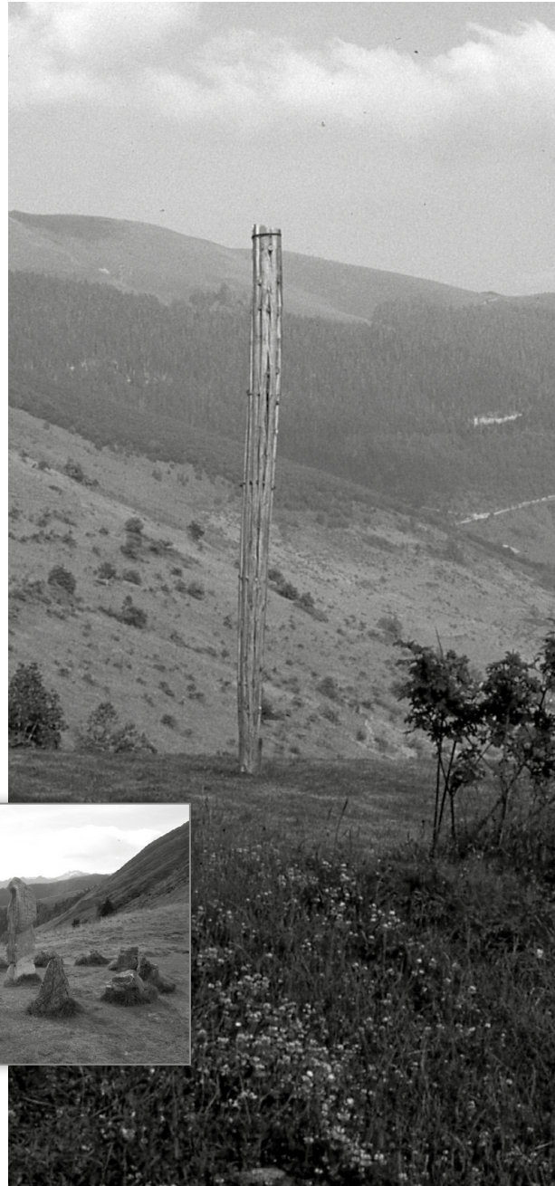
Grande Photographie : Halbar du Plan Mardan de Caubous, juin 1982 (BMM).

Carnaval comme la Saint-Jean ont une grande dimension de fertilisation liée au culte des morts, les halbars de la Lana de Garin, celui de Billière à Pèiralada ou encore celui de Medan à Juzet-de-Luchon étaient plantés au milieu de nécropoles antiques. Celui du Plan Mardan , à Caubous, est resenti comme un endroit mythique. C'est là que dansent es hades et que se trouvait l'ancienne chapelle de Saint-Christophe où l'on enterrait ceux qui étaient morts en montagne. Il domine toute Vathjús , la haute vallée d'Oueil, et est en alignement parfait avec le halbar de Mayrègne et le menhir de Pèira Hita , à Bourg d'Oueil. Ce parallélisme que nous venons de faire nous permet d'ajouter une chose terriblement évidente mais